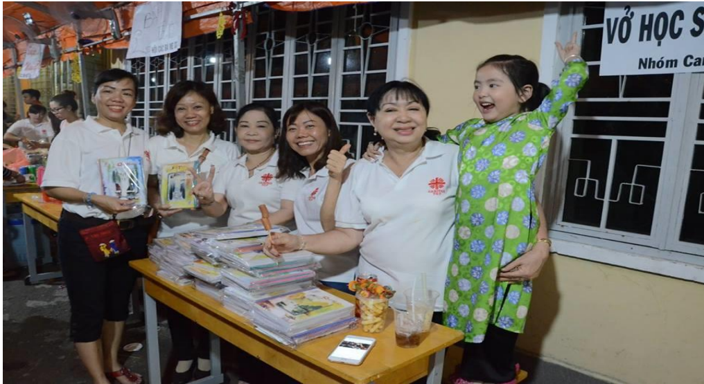
Sáng mừng một tết chúc tuổi Cha Xứ Sao Mai- TGH HHTM